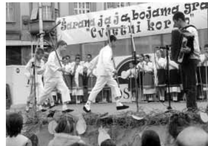
Veľkonočné obyčaje na Námestí Anteho Starčeviča v Osijeku: detská folklórna skupina KUS Fraňa Strapača z Našického Markovca mala program a pochodovala časťou "Cvijetni korzo".