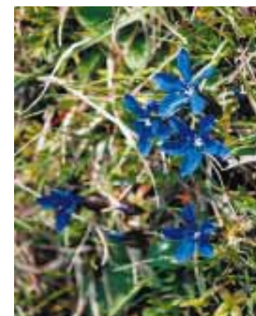
Encijan je raritena biljka Blidinje

matnima bosanske Katoličke crkve još 1067. godine. To su psi snažne građe koji se ne boje vukova.