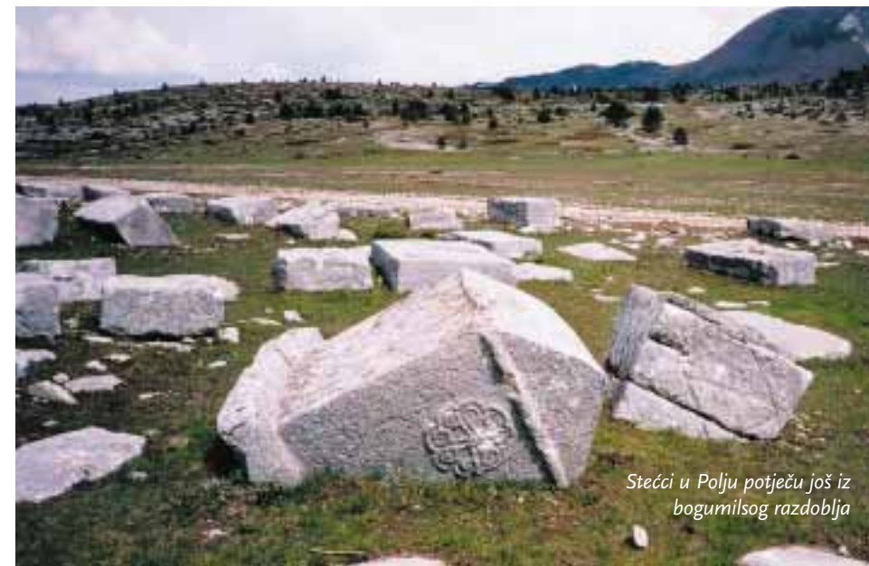
Stećci u Polju potječu još iz bogumilskog razdoblja