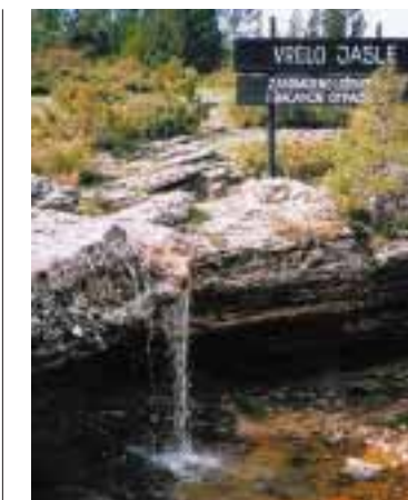
Ovdje je i vrelo rijeke Jasle