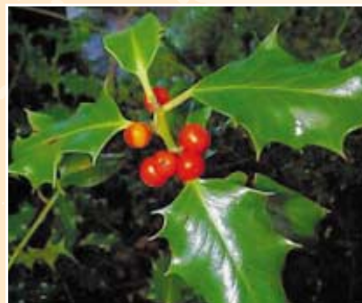
Božikovina - Ilex aquifolium L.