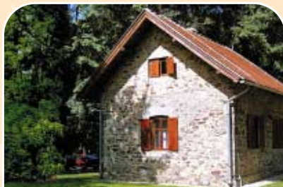
Lovačka kuća na Jankovcu

Park šuma Jankovac i cijeli prostor Papuka, idealno su stanište u kojem od krupne lovne divljači obitavaju jeleni, srne, divlje svinje i druga sitna divljač, a u modro bistrim jezerima udomaćena je pastrva. Lovne i ribolovne mogućnosti ovog prostora značajne su, a razvedenost terena i vegetacijska raznolikost pružaju izuzetan lovački doživljaj. Lov u svim godišnjim dobima, a posebno zimi u ovoj oazi mira i tišine, omogućuju istinski spoj s prirodom u savršenom obliku. Divljač je visoke trofejne vrijednosti a mjere gospodarenja koje se provode jamstvo su za budućnost.