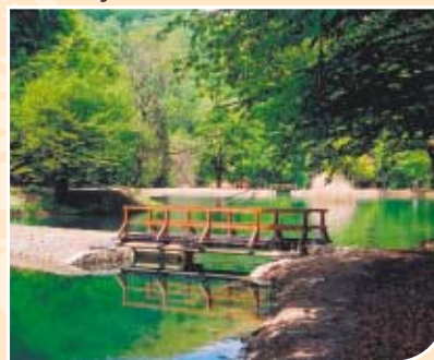
Staza uz jezero

Osim drveća te su šume bogate i prizemnim raslinjem od kojih su najzastupljenije vrste crna bazga, božikovina, klokočika, itd. Starost tih šuma je velika, a najveća je procjenjena na oko 160 godina.