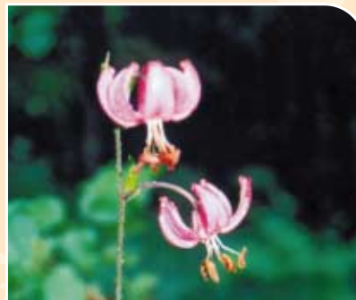
Pasji Zub - Erythronium dens - canis L.